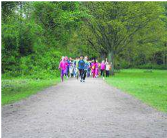
Kinder laufen für Indien von Hamburger WochenBlatt