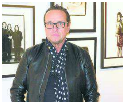
The Age of Rock von Hamburger WochenBlatt