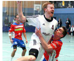
HG Hamburg-Barmbek - HT Norderstedt von Thomas Hoyer