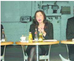
Von Anne Frank bis zum kleinen Vampir von Hamburger WochenBlatt