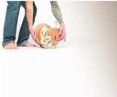
Tage des Holzes von Hamburger WochenBlatt