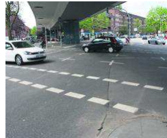
Tempo 30 auf der Fuhle gefordert von Hamburger WochenBlatt